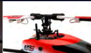
SAFE-Technologie SAFE Technology